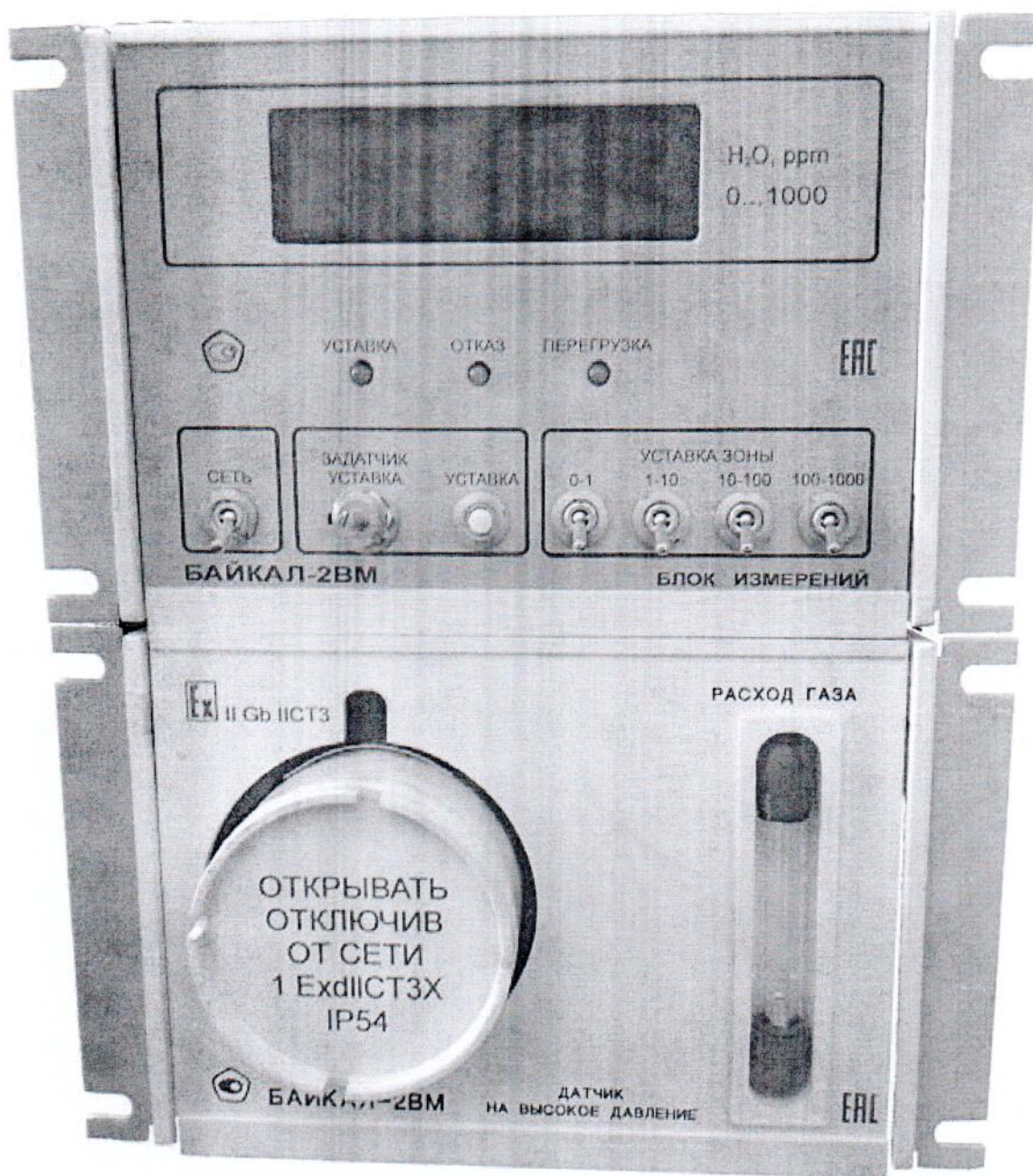
Рисунок 1 – Общий вид гигрометра кулонометрического БАЙКАЛ-2ВМ