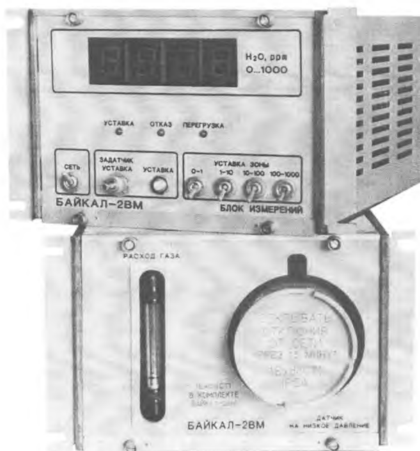
Рисунок – Гигрометр кулонометрический БАЙКАЛ-2ВМ