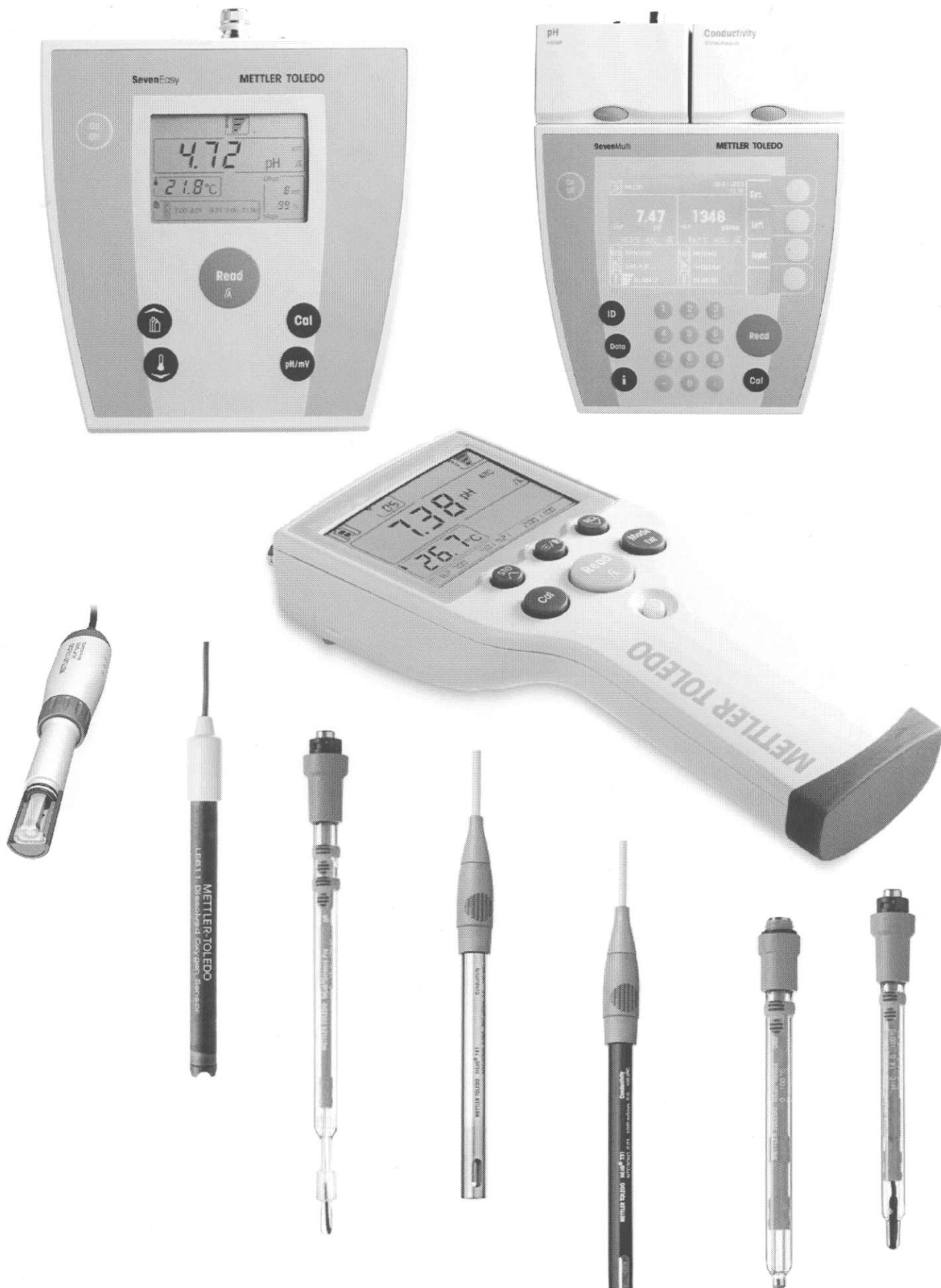
Рисунок 1 – Внешний вид анализаторов жидкости Seven.