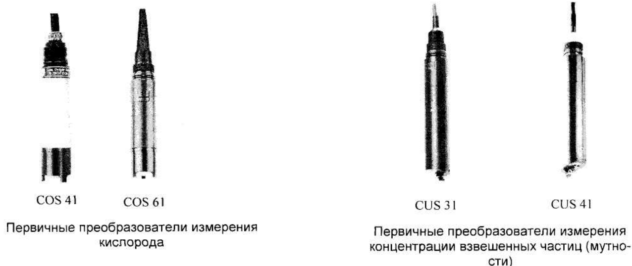
Рисунок 1- Внешний вид анализаторов жидкости Liguisys (измерительный преобразователь Liguisys М, первичные преобразователи для измерения удельной электрической проводимости, концентрации растворенного в воде кислорода, концентрации взвешенных частиц (мутности), электроды для измерения активности ионов (pH)).