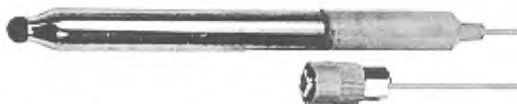
Рисунок 1 – Общий вид электрода стеклянного промышленного ЭО-01СР