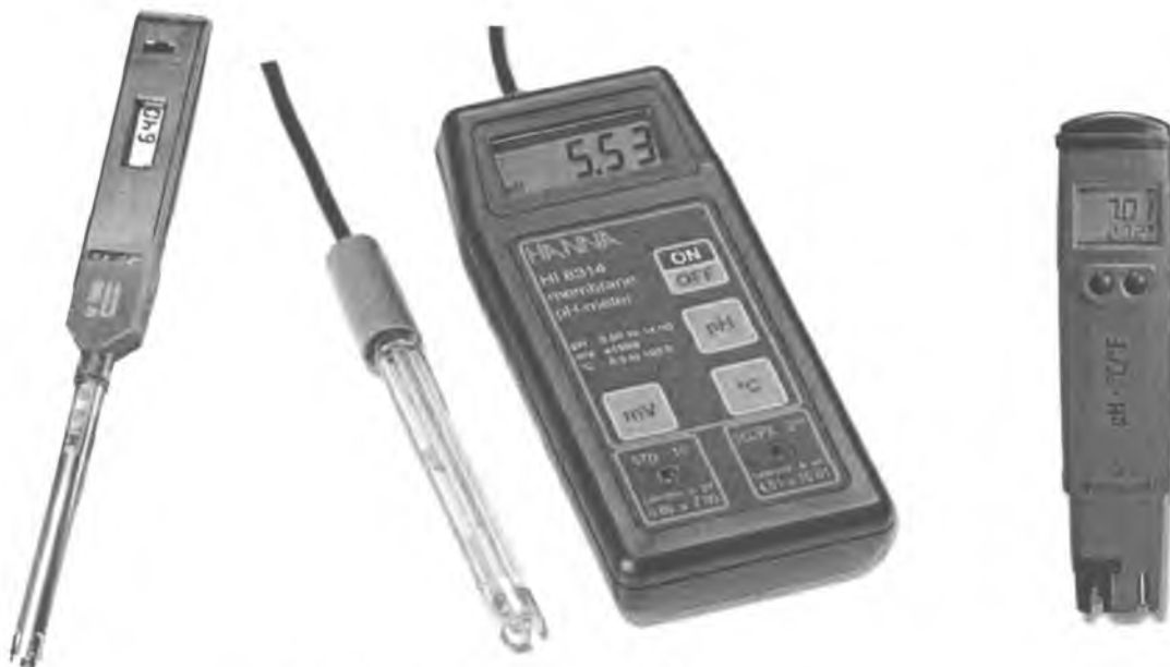
Рисунок 1 –Внешний вид pH-метров