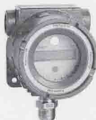
Polytron 2 XP Ex