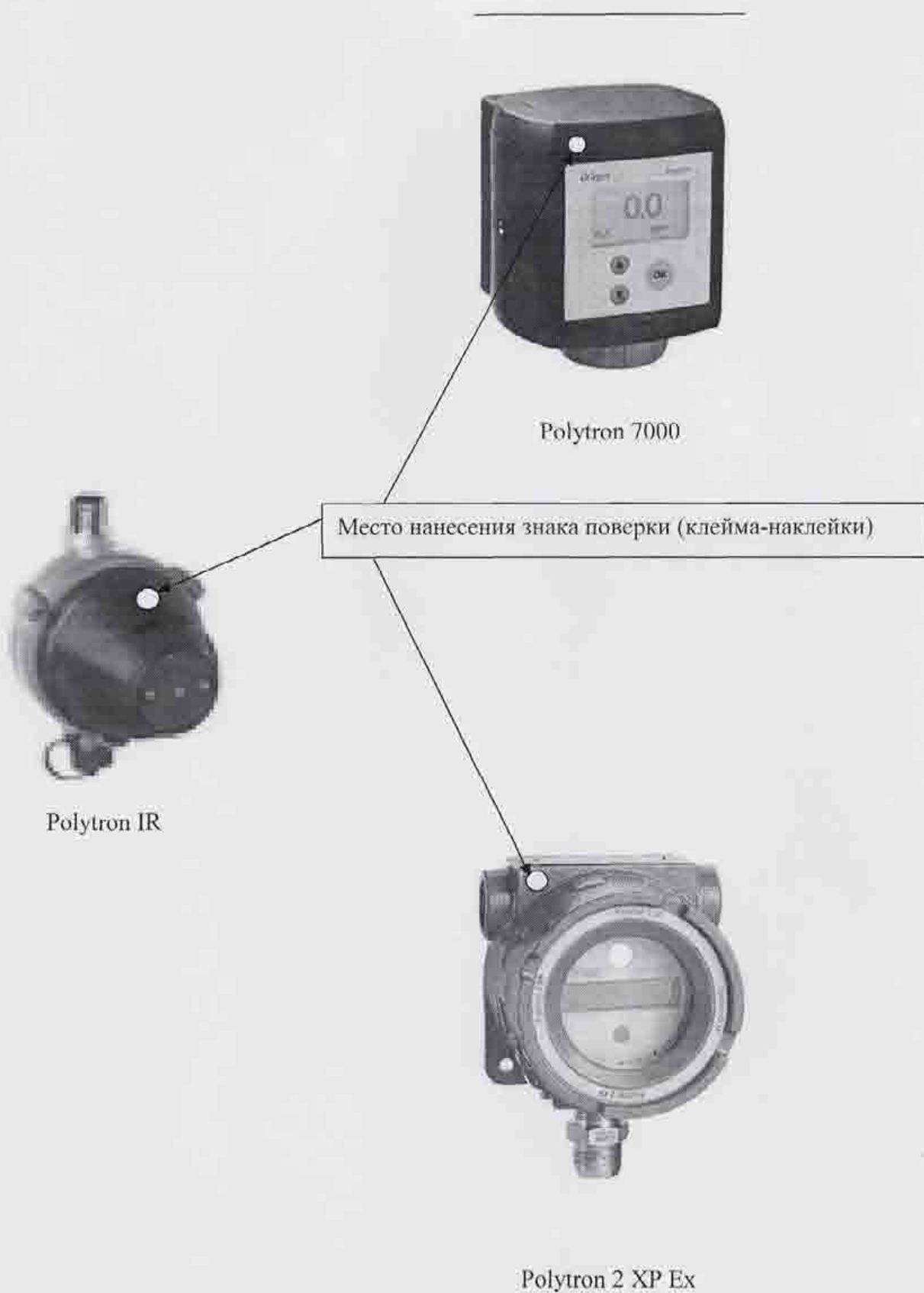
Схема с указанием места нанесения знака поверки (клейма-наклейки).