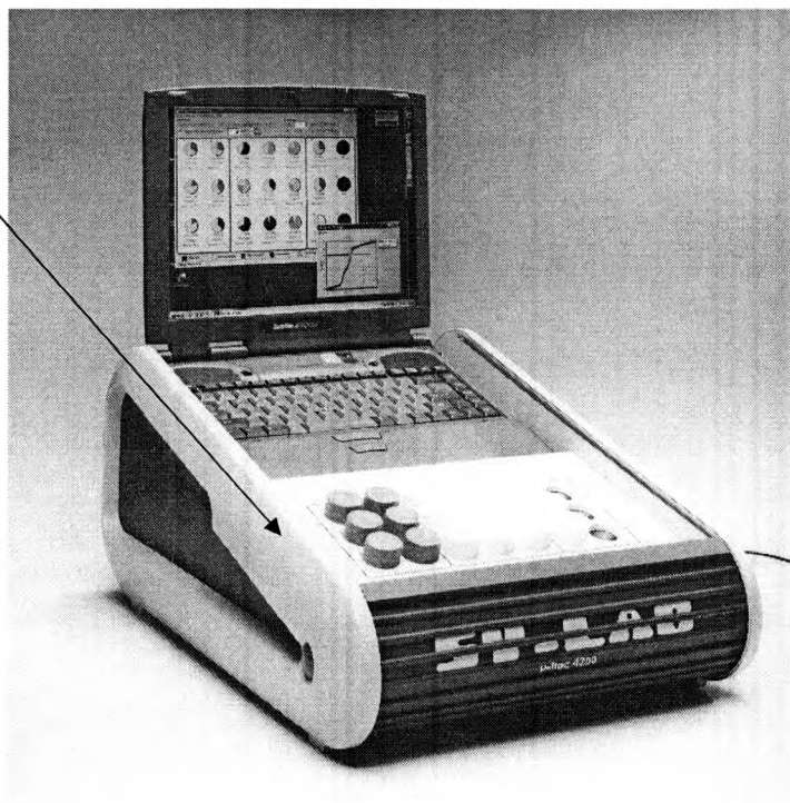
Рисунок А.2 Внешний вид измерителя "БиоТрак 4250"

Место нанесения знака поверки (клейма-наклейки)