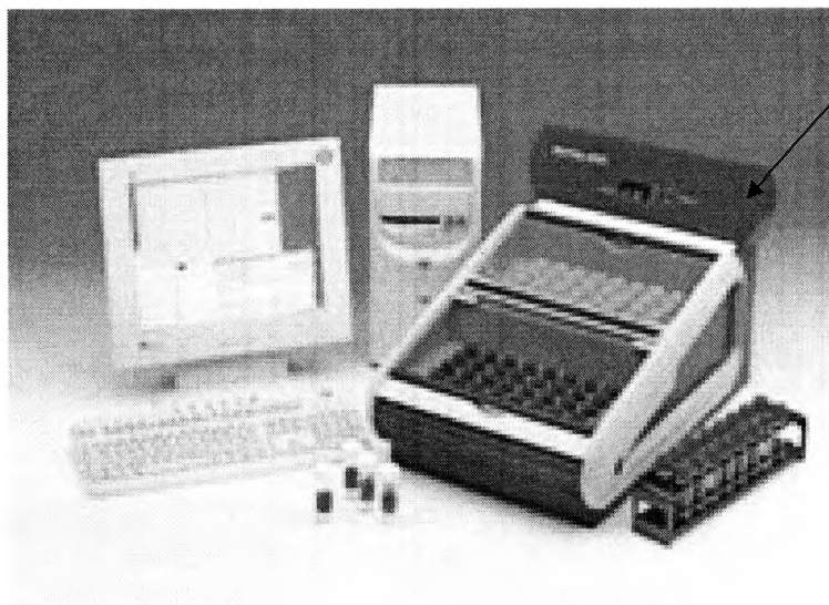
Рисунок А.1 Внешний вид измерителя "БакТрак 4300"

Место нанесения знака поверки (клейма-наклейки)