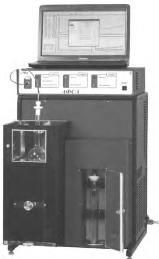
Рисунок 1. "АФС-4"