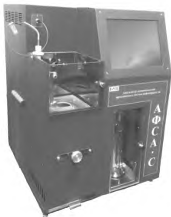
Рисунок 2. "АФС-С"