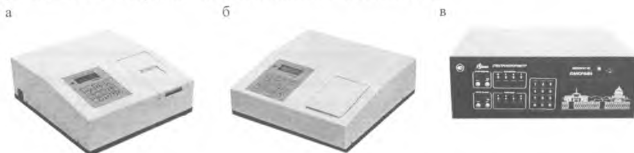
Рис.1 - Внешний вид анализаторов жидкости «Флюорат-02». а - модификация «Флюорат-02-2М», б - модификация «Флюорат-02-3М», в - модификация - «Флюорат-02-Панорама»

Внешний вид модификаций анализаторов приведен на рисунке 1. Модификации «Флюорат-02-2М» и «Флюорат-02-3М» имеют одинаковый внешний вид.