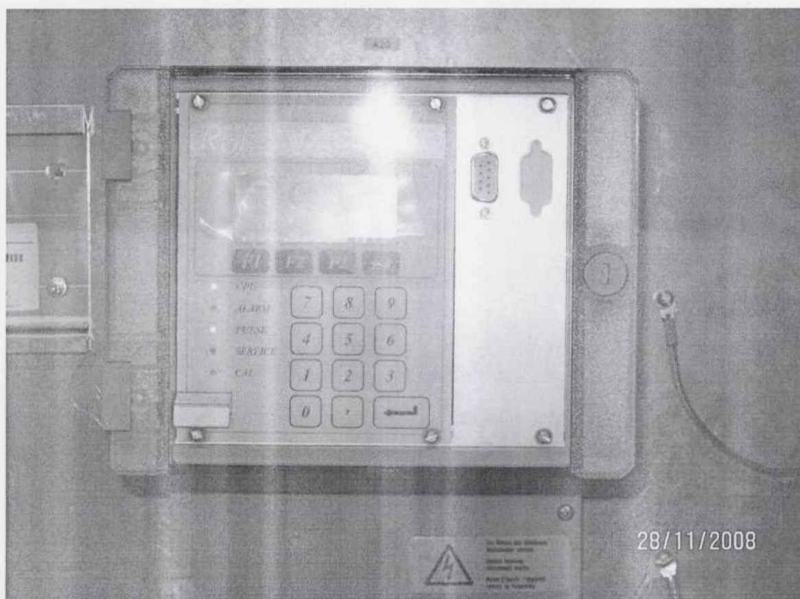
Рис. 1 А. Плотномер DECON 21