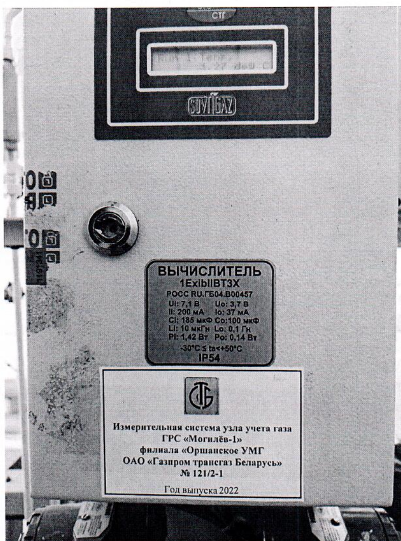
Рисунок 1.1 – Фотографии общего вида ИС УУГ