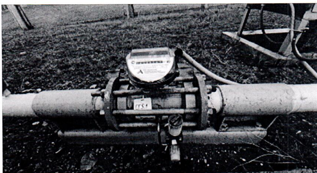
Рисунок 1.1 – Фотографии общего вида ИС УУГ