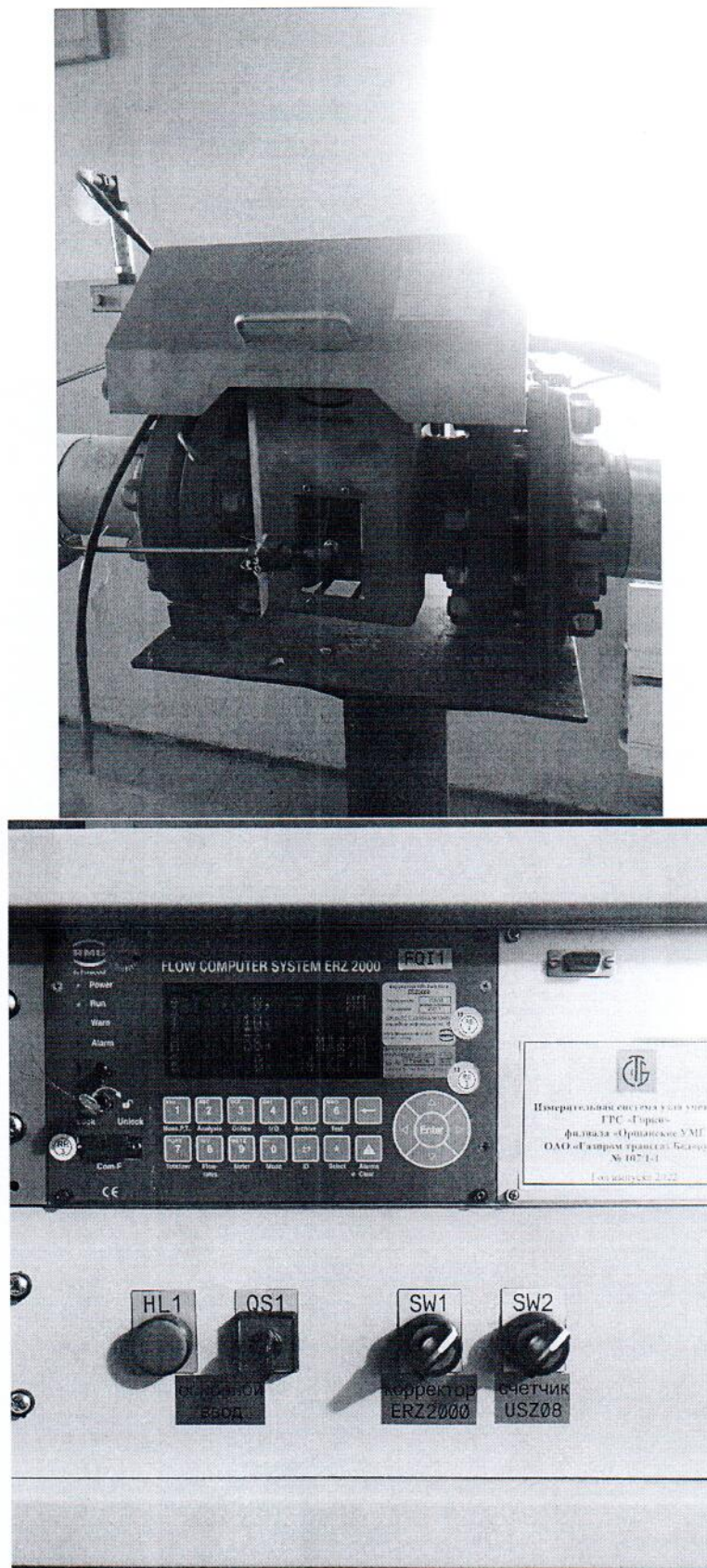
Рисунок 1.1 – Фотографии общего вида ИС УУГ

Фотографии общего вида средств измерений