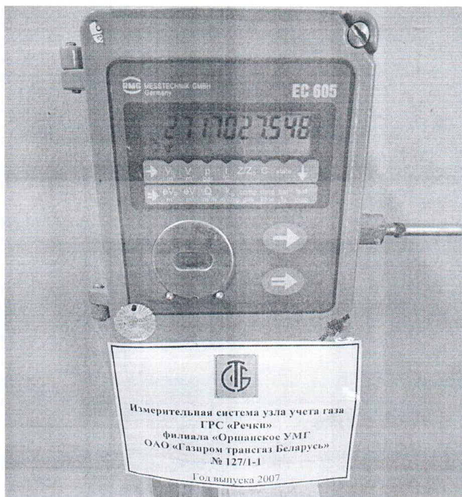
Рисунок 1.2 – Фотография маркировки ИС УУГ