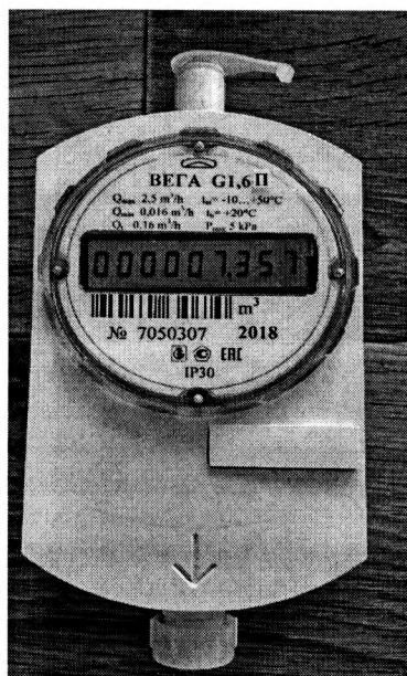
Рисунок 2 – Общий вид счетчиков газа ультразвуковых БЕГА-Gx-П