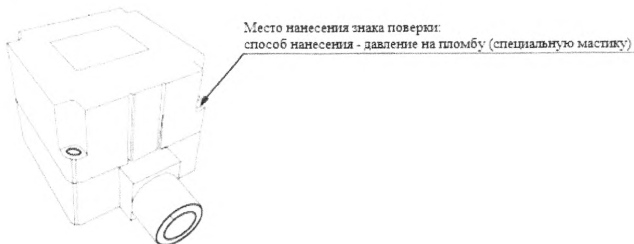
Рисунок 2 – Схема пломбировки от несанкционированного доступа, обозначение места нанесения знака поверки