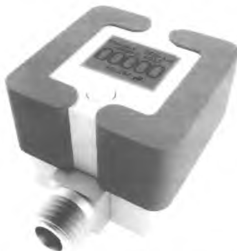
Рисунок 1 – Внешний вид счетчиков

Внешний вид счетчиков представлен на рисунке 1, схема пломбирования – на рисунке 2.