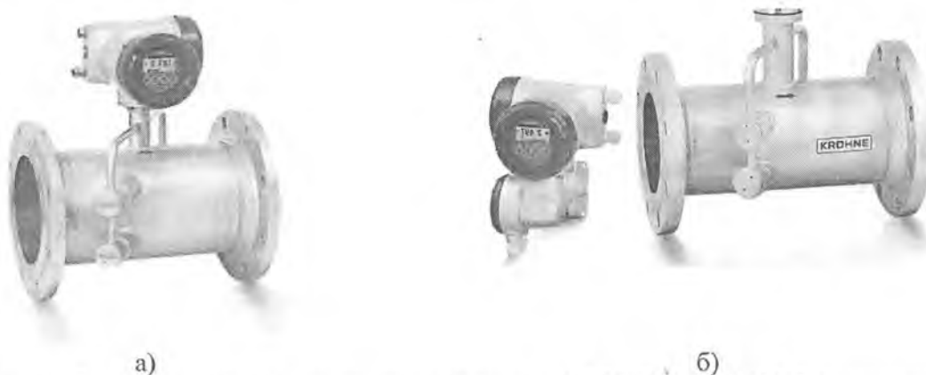
Р и с у н о к 1 – Расходомеры-счётчики ультразвуковые: а) OPTISONIC 3400 C (компактное исполнение, б) OPTISONIC 3400 F (раздельное исполнение).

Расходомеры-счётчики ультразвуковые OPTISONIC 3400, в зависимости от исполнения, могут оснащаться аналоговым выходом (0...20) мА, частотным (импульсным) выходом, дискретным выходом, дискретным входом, аналоговым входом, интерфейсами Modbus RTU, HART, PROFIBUS и Foundation Fieldbus.