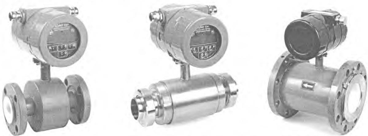
Рисунок 1 - Общий вид расходомеров-счетчиков электромагнитных «ВЗЛЕТ ТЭР»

Общий вид расходомеров приведен на рисунке 1.