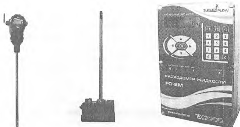
Рисунок 1 – Расходомер жидкости PC-2M

На рисунке 2 приведена схема пломбирования и обозначение мест для нанесения пломб в целях предотвращения несанкционированного вмешательства.