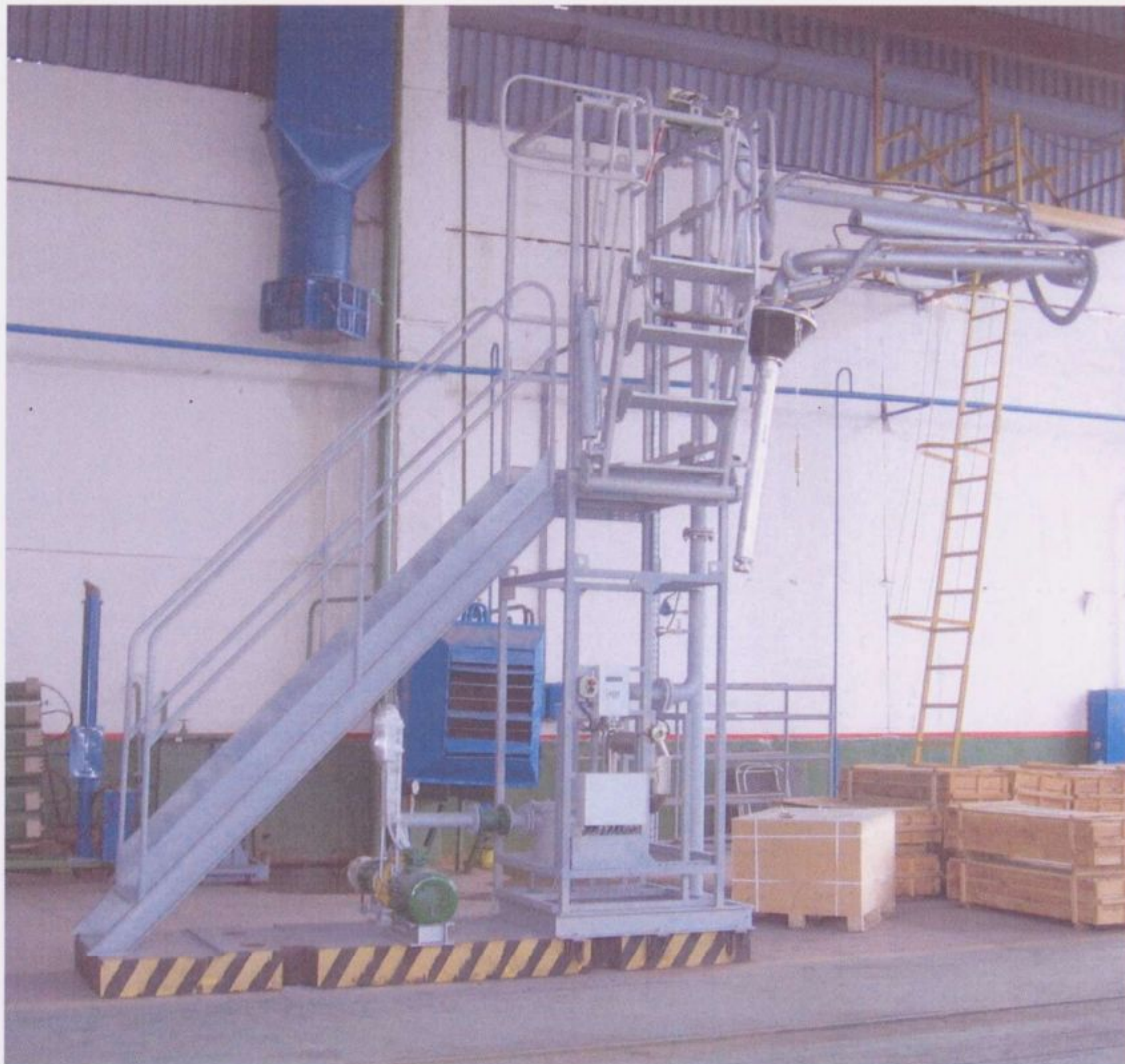
Рисунок 1. Система автоматизированная налива нефтепродуктов в автоцистерны

Внешний вид системы автоматизированной налива нефтепродуктов в автоцистерны приведен на рисунках 1,2.