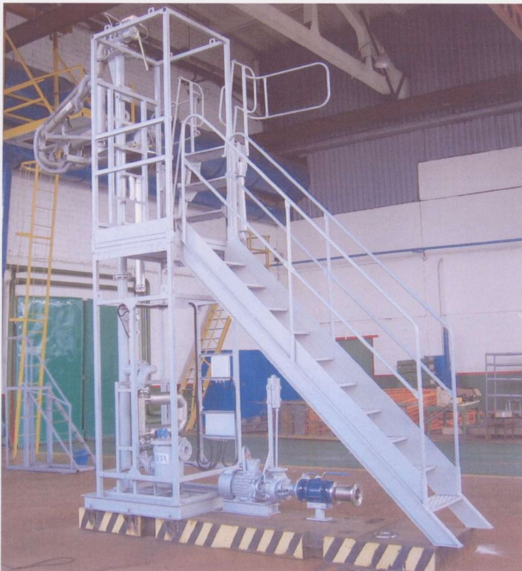
Рисунок 2. Система автоматизированная налива нефтепродуктов в автоцистерны

Система автоматизированная налива нефтепродуктов в автоцистерны состоит из: