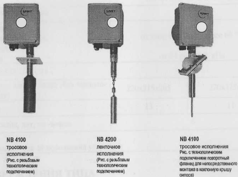
Устройства модификации NB 4000