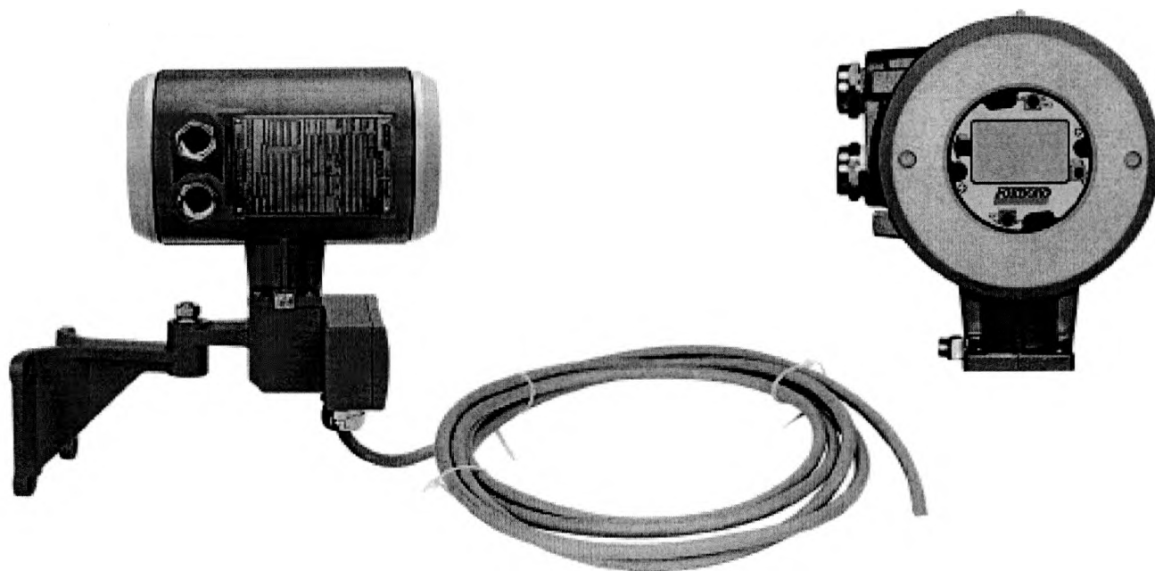
Рисунок 2 – Внешний вид микропроцессорного преобразователя CFT50