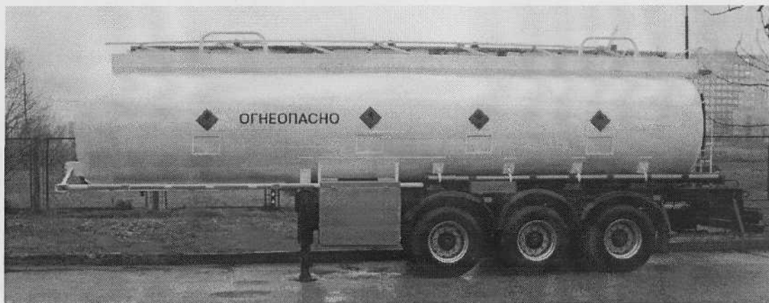
Рисунок 1. Общий вид полуприцепа-цистерны

Схема пломбировки полуприцепа-цистерны от несанкционированного доступа с указанием места нанесения знака поверки приведена в Приложении А.