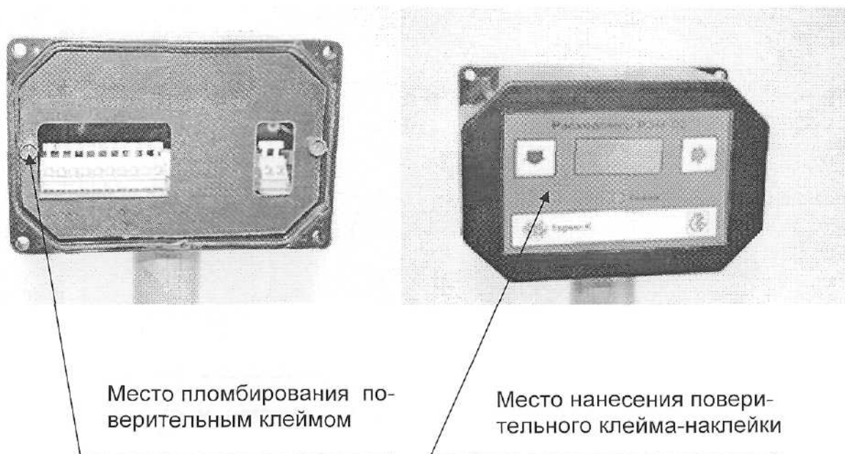
Рисунок А.1 Место нанесения поверительного клейма-наклейки и пломбирования поверительным клеймом

Схема с указанием мест нанесения поверительного клейма – наклейки и пломбирования поверительным клеймом расходомера.