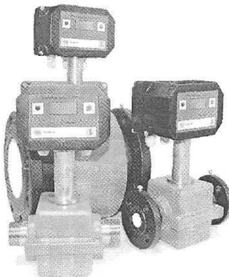
Рисунок 1 Внешний вид расходомеров электромагнитных РЭМ-02

Внешний вид расходомеров приведен на рисунке 1.