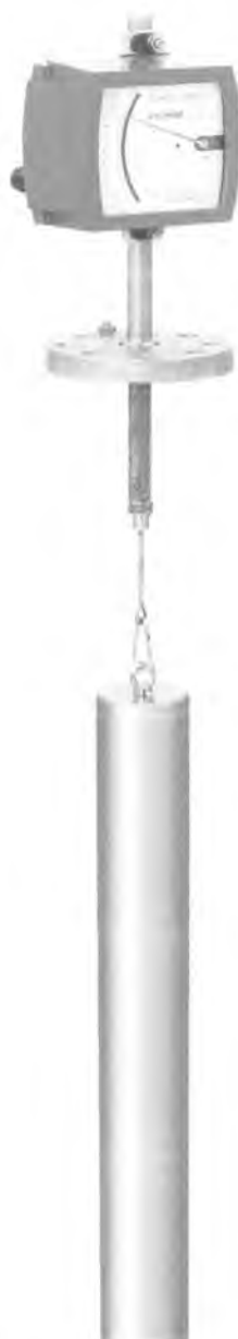
Рисунок 2. Уровнемер буйковый BW 25/ М9