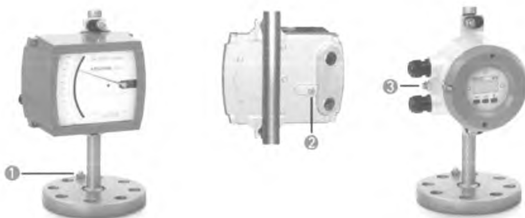
Рисунок 1. Внешний вид показывающих устройств уровнемера BW 25: 1,2 – показывающее устройство М9; 3 – показывающее устройство М10