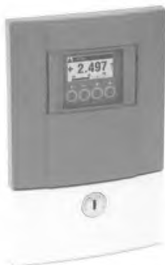
UFC 300W – раздельная версия для настенного монтажа

Электронный преобразователь (конвертор) ультразвукового расходомера