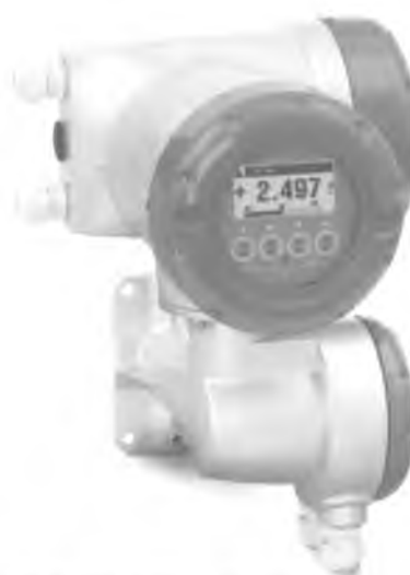
UFC 300F, UFC 400F – раздельная версия