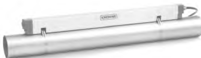
Накладной ультразвуковой преобразователь расхода OPTISONIC 6000