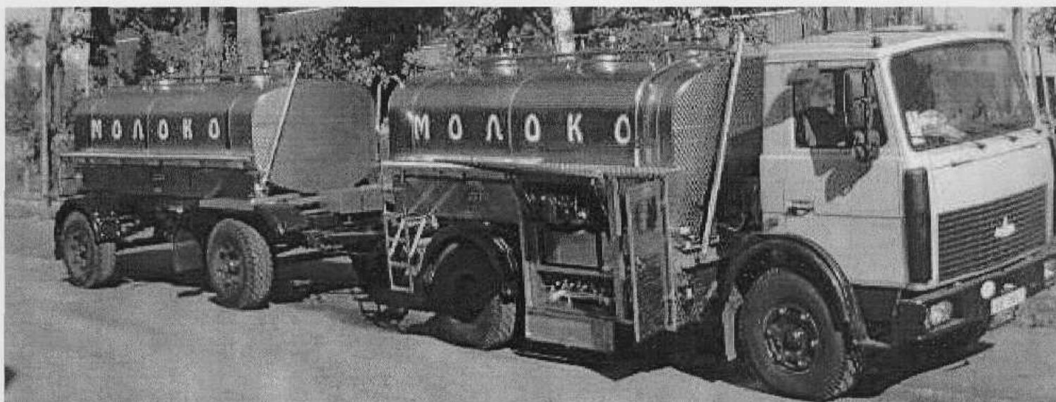
Рис.1 – Внешний вид автомолокоцистерны СМА с расходомерным устройством PD-340