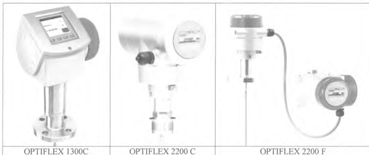
Рисунок 1. Общий вид вычислительных блоков уровнемеров

Внешний вид уровнемеров и варианты исполнения сенсоров представлены на рисунках 1, 2 и 3.