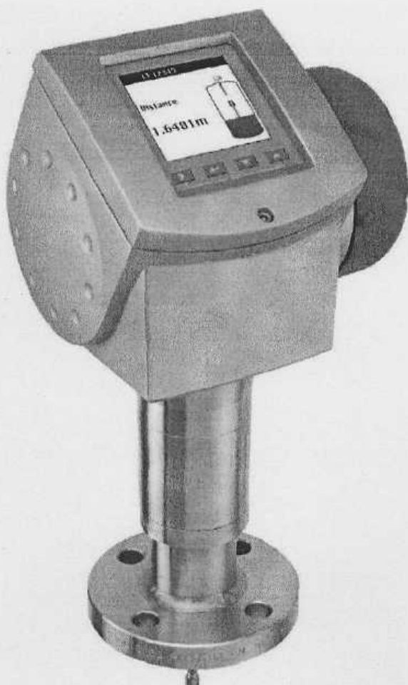
Рисунок 1. Общий вид уровнемера OPTIFLEX 1300C с дисплеем

Внешний вид уровнемеров и варианты исполнения зондов представлены на рисунках 1, 2 и 3.