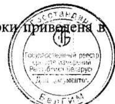
Схема пломбировки колонки с указанием мест нанесения знака поверки приведена в Приложении А.

Внешний вид колонок приведен на рисунке 1.