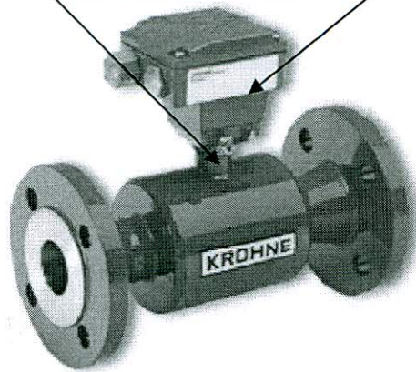
Рисунок А.1 Место нанесения знака поверки в виде клейма-наклейки и знака поверки в виде оттиска металлического клейма

Место нанесения знака поверки в виде клейма-наклейки