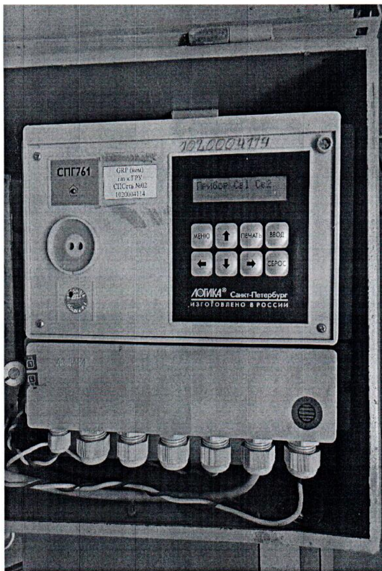
Рисунок 1.3 – Фотография корректора. Система измерительная узла учета газа № 302-01