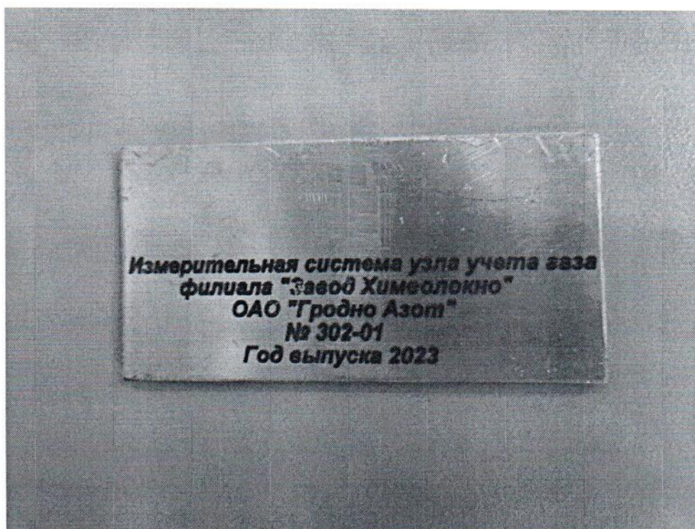
Рисунок 1.1 – Фотография маркировки. Система измерительная узла учета газа № 302-01

Фотографии общего вида средства измерений