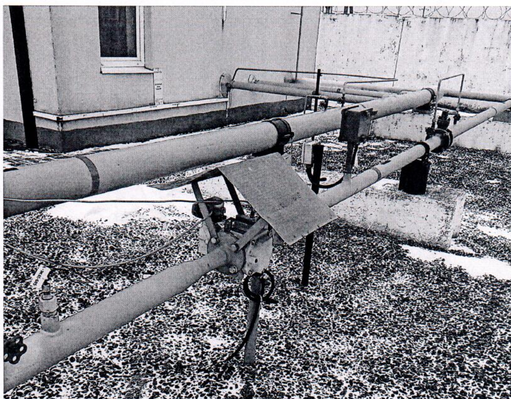
Рисунок 1.1 – Фотографии общего вида ИС УУГ