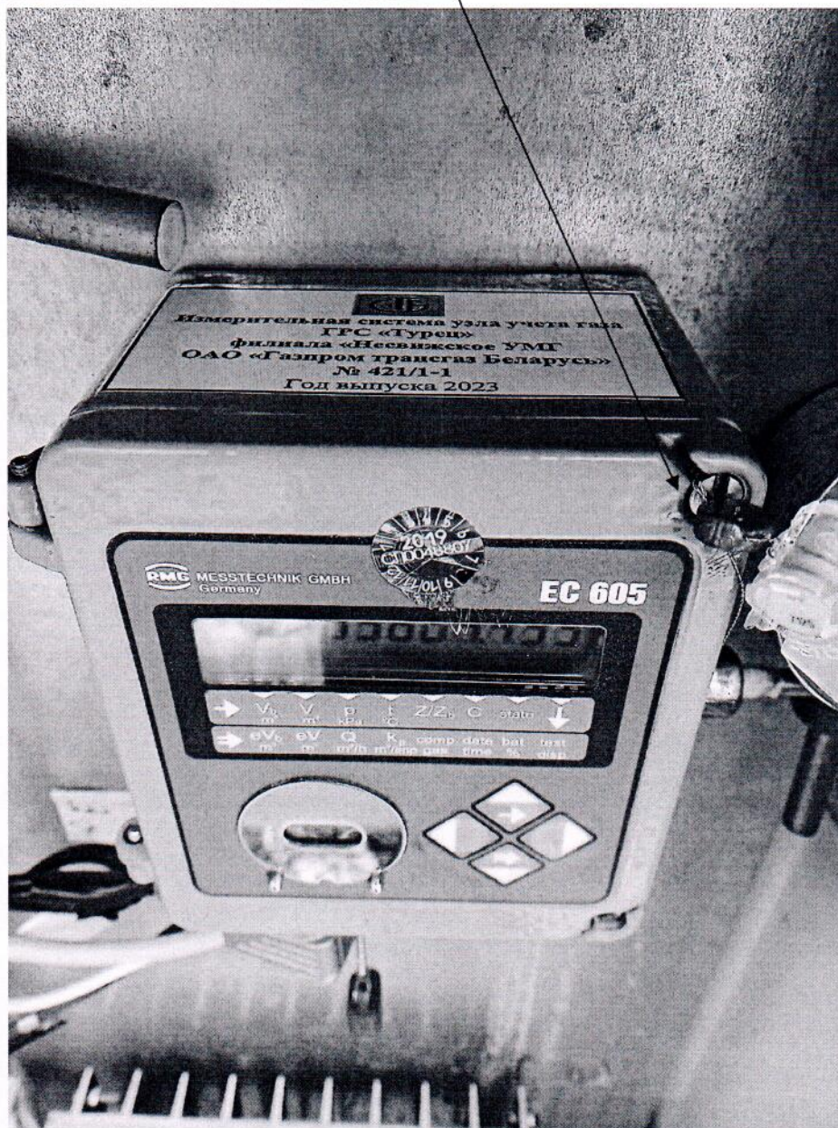
Рисунок 3.1 – Схема пломбировки от несанкционированного доступа

Место пломбировки от несанкционированного доступа