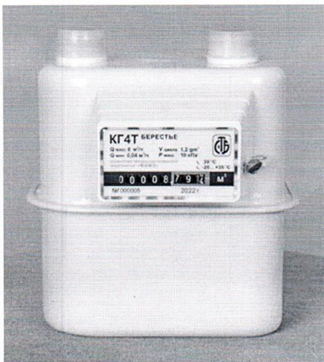
Счетчики КГ4; КГ4Т