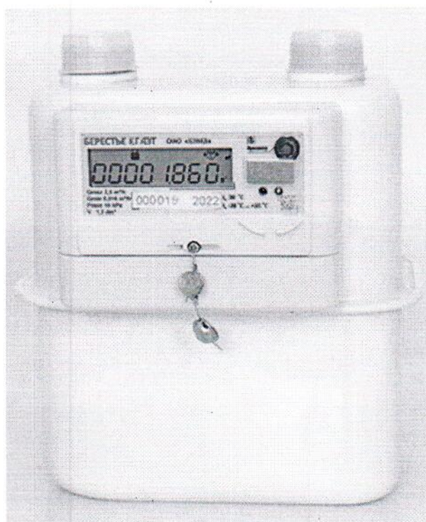
Счетчики КГ4Э; КГ4ЭТ