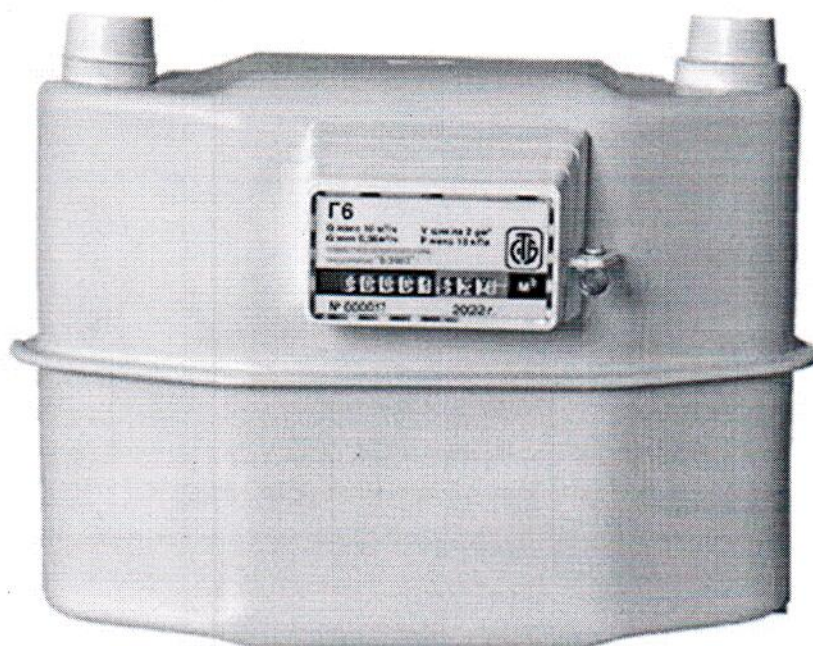
Счетчики Г6; Г6Т