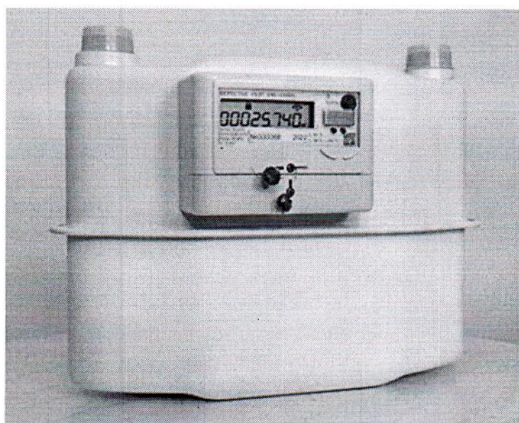
Счетчики Г6Э; Г6ЭТ