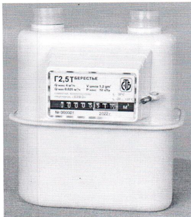
Счетчики Г2,5; Г2,5Т