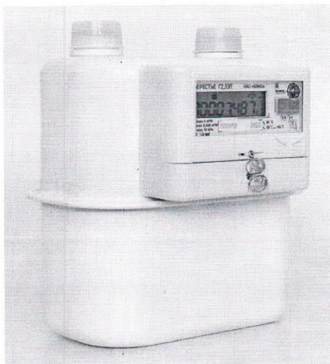
Счетчики Г2,5Э; Г2,5ЭТ