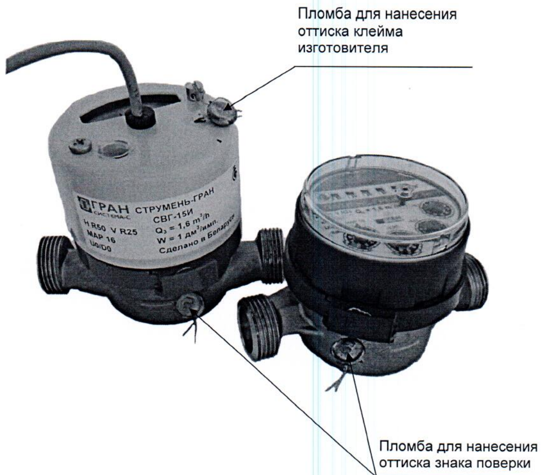
Рисунок А.1 – Места пломбирования счетчиков воды «СТРУМЕНЬ-ГРАН»