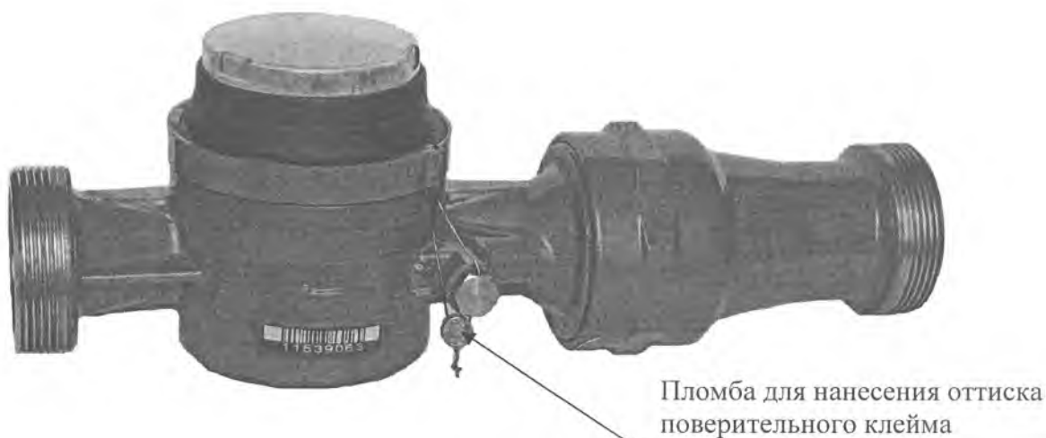
Рисунок А.1 – Места клеймения и пломбирования счетчиков СВ-25 «СТРУМЕНЬ», СВ-32 «СТРУМЕНЬ», СВ-40 «СТРУМЕНЬ»