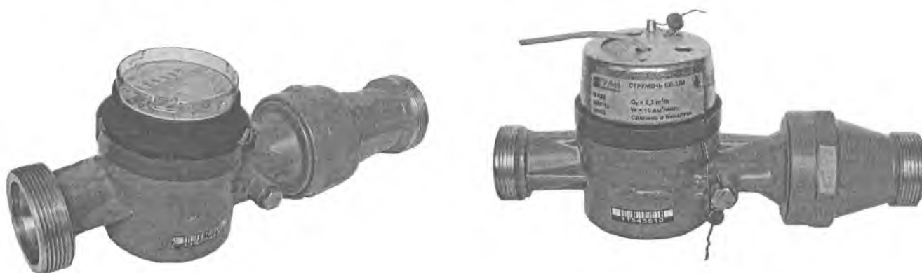
Рисунок 1 – Внешний вид счетчиков со стандартным счетным механизмом

Схема с указанием места клеймения и пломбирования указана в приложении А к описанию типа.