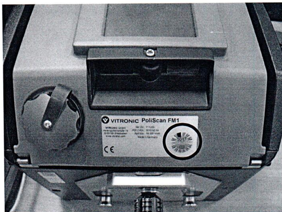
Рисунок А.1 – Место нанесения знака поверки (клейма-наклейки) на измеритель скорости транспортных средств лазерный PoliScan FM1

Обозначение мест для нанесения знака поверки и пломб от несанкционированного доступа