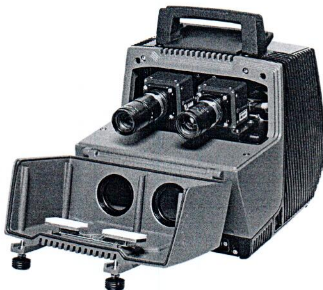
Рисунок 3 – Конструкция измерителя скорости PoliScan FM1 (исполнение с двумя камерами)