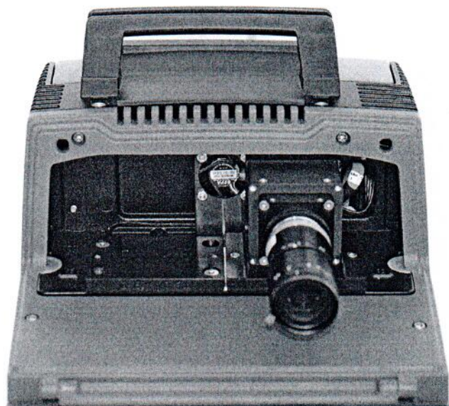
Рисунок 2 – Конструкция измерителя скорости PoliScan FM1.SR (исполнение с одной камерой)