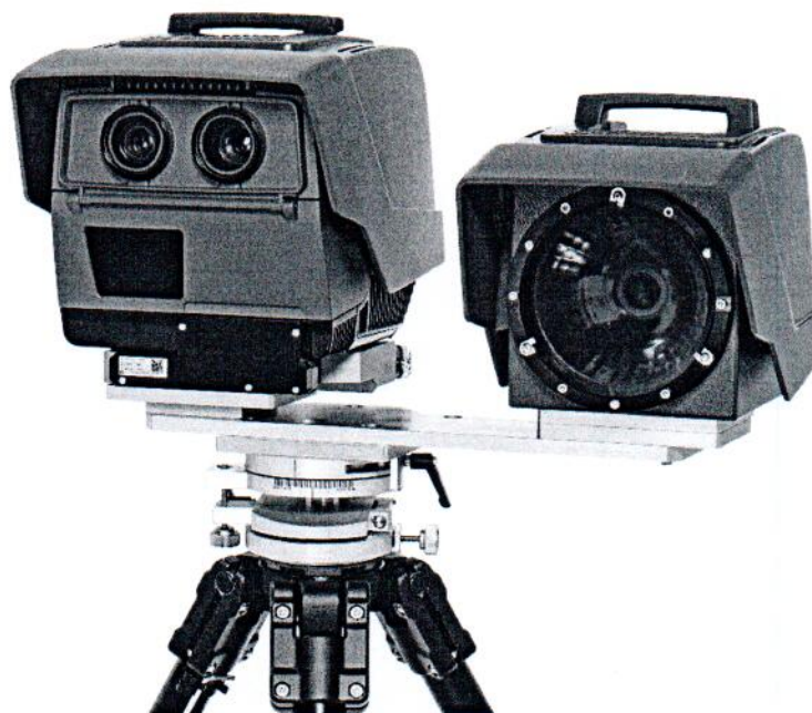
Рисунок 1 – Внешний вид измерителя скорости

Внешний вид измерителей скорости представлен на рисунках 1-3.