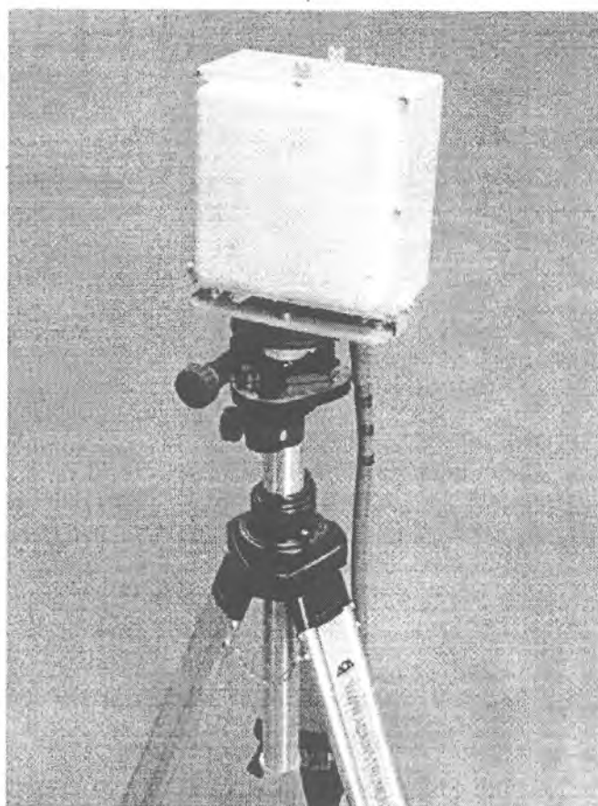
Рисунок 1. Внешний вид имитатора