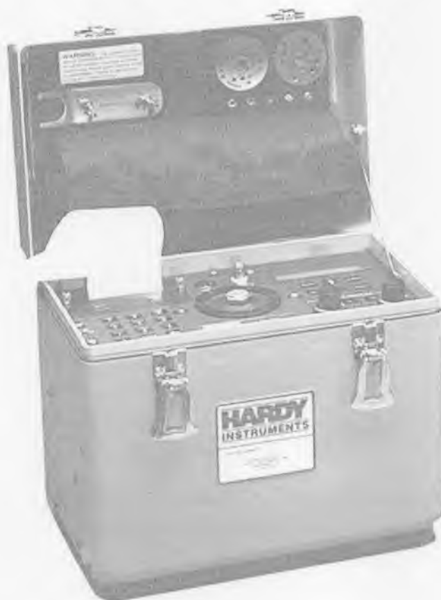
Рисунок 2 – Внешний вид установки