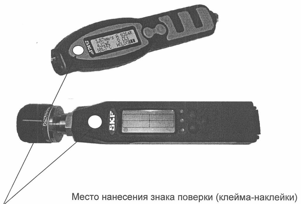
Рисунок А.1 – Место нанесения знака поверки (клейма-наклейки)