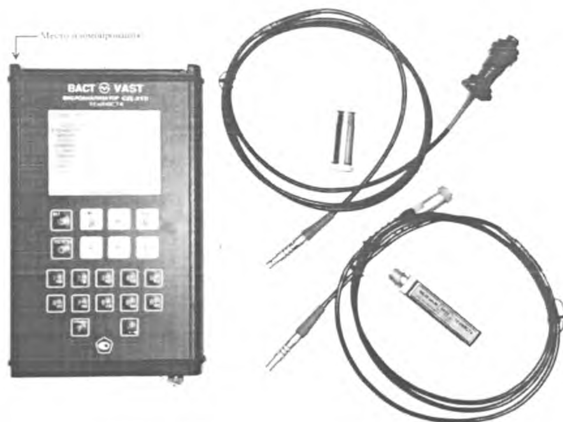
Рисунок 1 - Внешний вид и место пломбирования СД-21В

Виброанализаторы СД-21В предназначены для работы во взрывоопасных помещениях, имеет маркировку взрывозащиты IExibIICT4 X, разрешение на применение во взрывоопасных зонах помещений и наружных установок (разрешение № РРС 00-047461) и работают с вибропреобразователями типа ICP, имеющими маркировку взрывозащиты IExibIICT4.