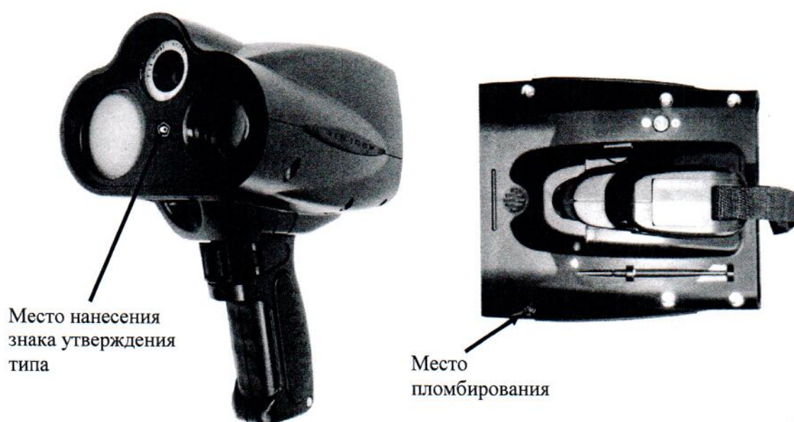
Рисунок 1 - Общий вид и место пломбирования измерителей скорости движения транспортных средств радиолокационных с видеофиксацией «БИНАР»

Общий вид и место пломбирования измерителей показаны на рисунке 1.