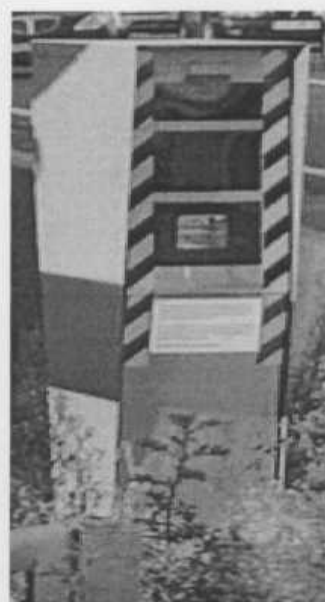
в) MESTA 2000