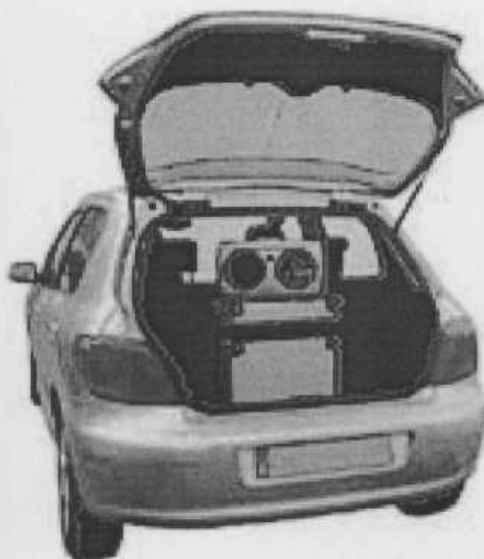
б) MESTA 1200