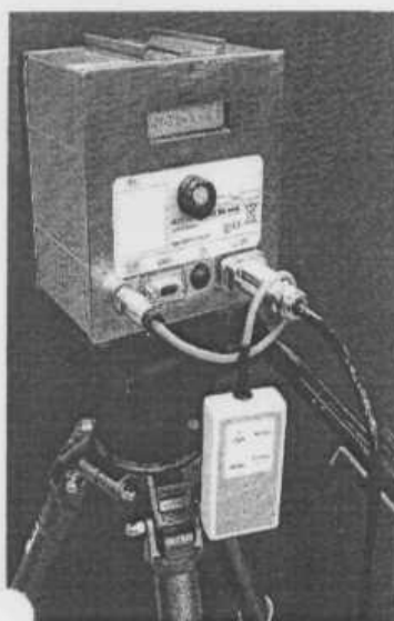
а) MESTA 1200

Внешний вид системы и измерителя скорости радиолокационного MESTA 210C представлен на рисунке 1.