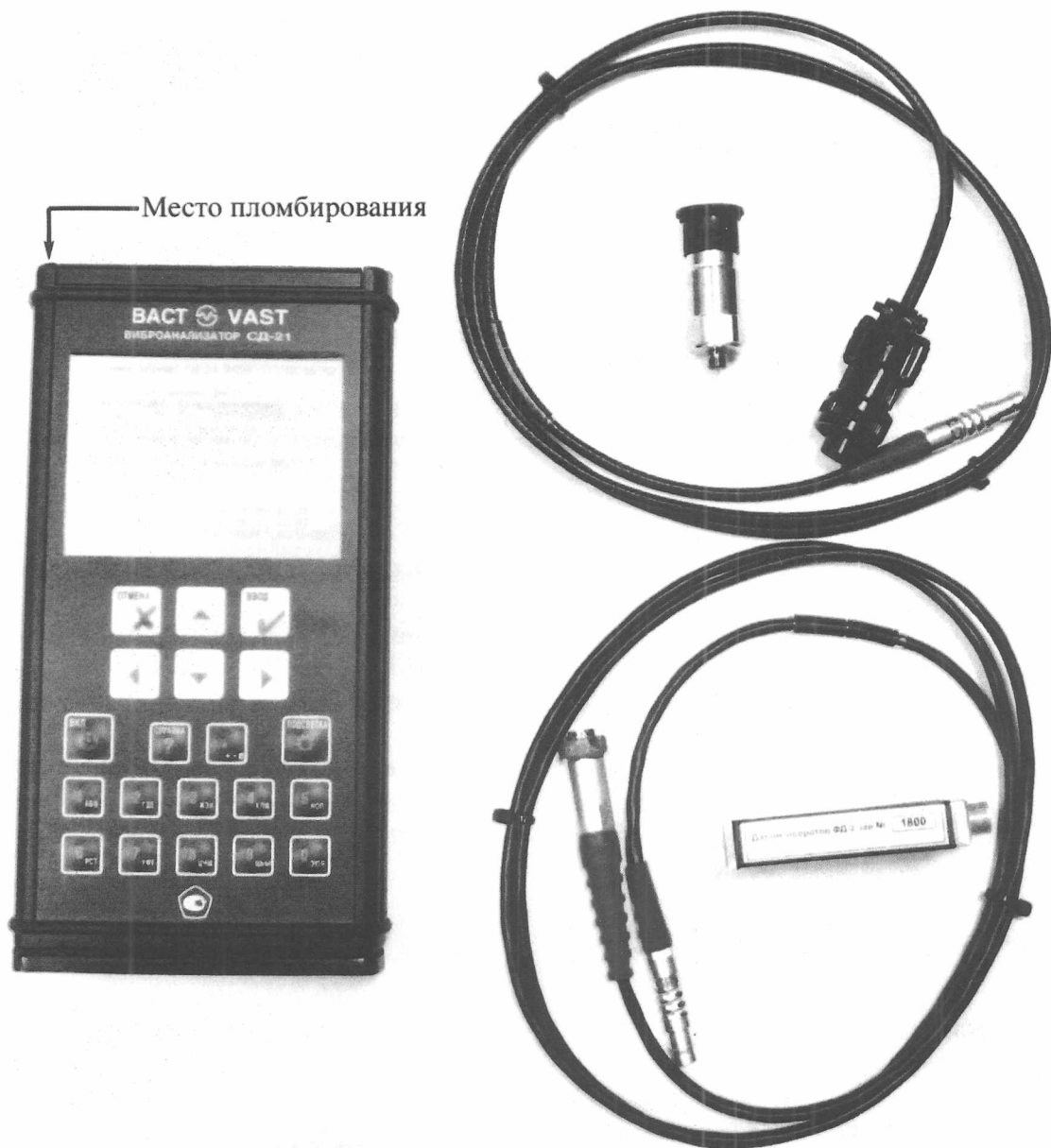
Рисунок 1. Внешний вид и место пломбирования СД-21

Программное обеспечение предназначено для управления виброанализатором, а также получения и сохранения результатов измерений.