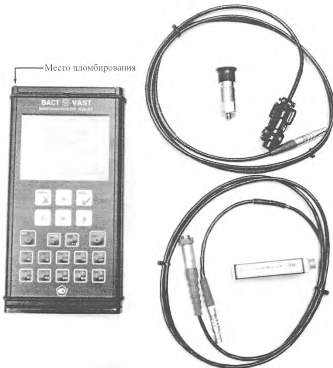
Рисунок 1. Внешний вид и место пломбирования СД-21