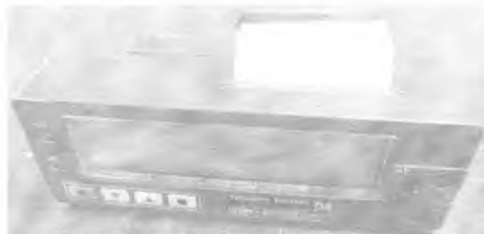
Рисунок 1 – Внешний вид таксометра